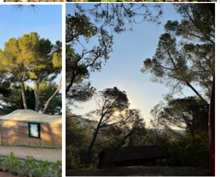
Ausblick von unserem Platz