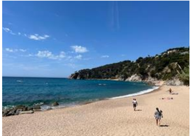
Strand Tossa de Mar Cala Llevada