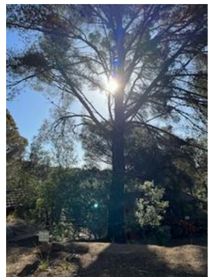
Camping Cala Llevada